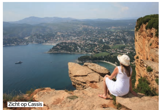
Zicht op Cassis

De Cours Mirabeau, met huizen als paleizen, deelt het oude centrum in tweeën. Voor vertier moet je naar de ene kant, voor cultuur naar de andere, want vrijwel alle musea liggen in de chique wijk Mazarin. Begin bij Musée Granet, de oude kunstacademie waar Cézanne zijn eerste lessen kreeg. De collectie is een lange en heel ▶